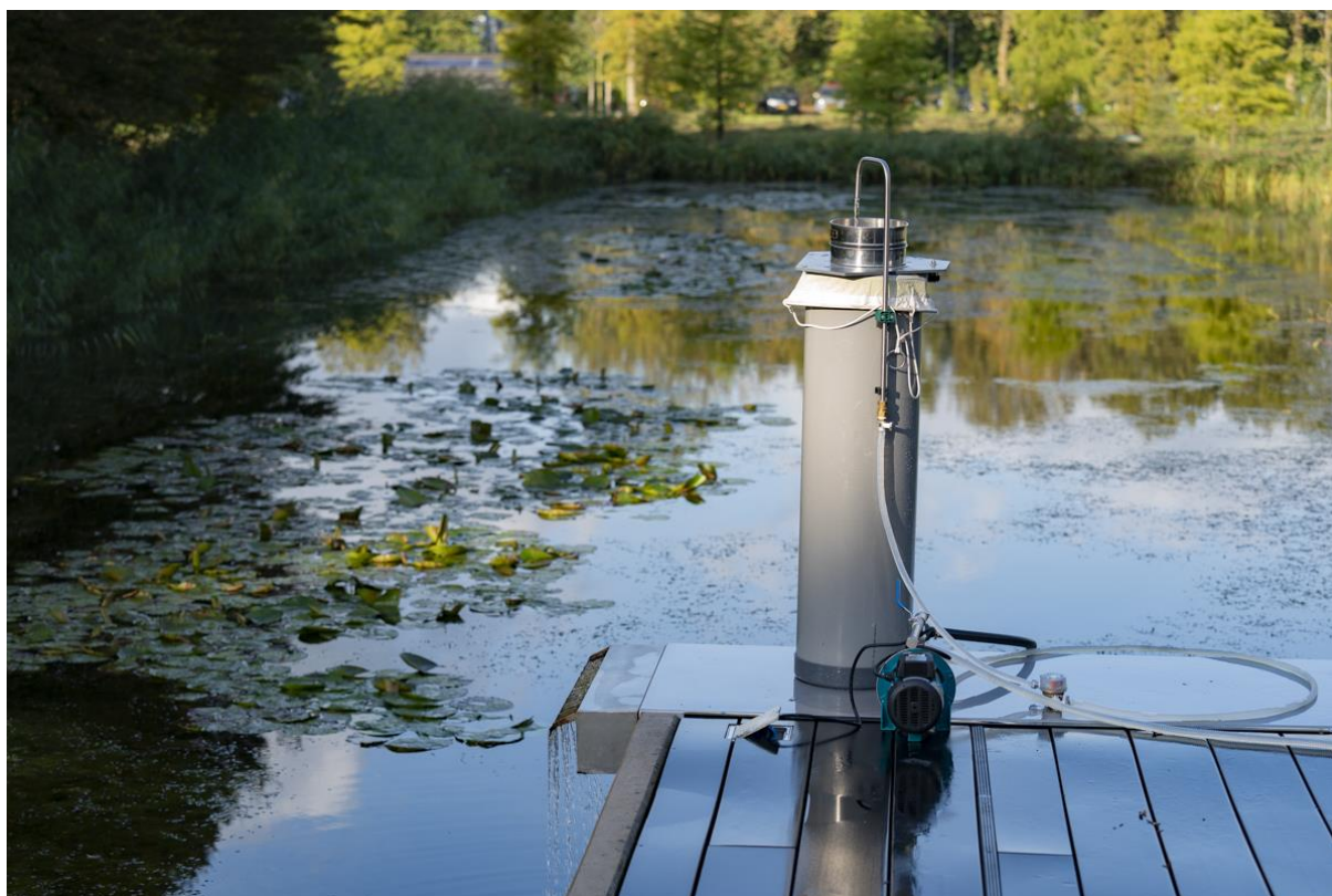
Figuur 2. Een draagbaar filter-systeem waarmee microplastics in het veld kunnen worden geconcentreerd.

Naast deze visuele technieken is er ook de mogelijkheid om plasticdeeltjes met bijvoorbeeld TGA (thermogravimetrische analyse) of pyrolyse in combinatie met gas chromatografie en massaspectrometrie (GC/MS) te karakteriseren, waarbij deeltjes die te klein zijn voor de microscopische analyse ( <1 \mu\text{m} ) alsnog gedetecteerd kunnen worden. Deze techniek is echter destructief en levert geen informatie wat betreft de grootte van het deeltje. In tegenstelling tot de visuele technieken, welke de hoeveelheid plastics per monster in getelde deeltjes weergeven, geeft pyrolyse de hoeveelheid plastic in gewicht weer, wat een onderling vergelijking van de twee verschillende methodes bemoeilijkt.